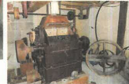
Appareil à cylindres.